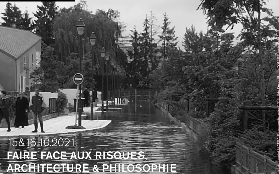
crédit : projet MATRA Romorantin, crue 2016, Éric DANIEL-LACOMBE architecte